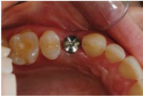
Gesetztes einphasiges Implantat.

Das „ einphasige Implantat “ ragt von Anfang an in die Mundhöhle hinein. Das „ zweiphasige Implantat “ ist in der Einheilungsphase vollständig von Zahnfleisch bedeckt. Nach der Einheilung wird es durch einen kleinen chirurgischen Eingriff freigelegt. Dann kann die Krone oder der Zahnersatz befestigt werden.